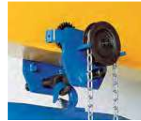
Trole o carro mecánico de cadena de 1 a 20 t