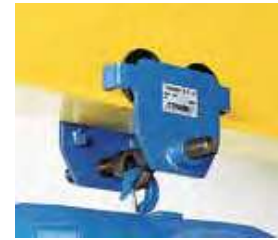
Trole o carro manual ½ a 10 t