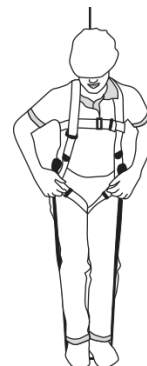
5 Párese sobre el lazo, de modo que las correas de los muslos se muevan libremente.