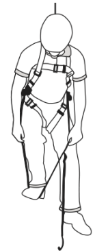
4 Coloque sus pies en el loop.