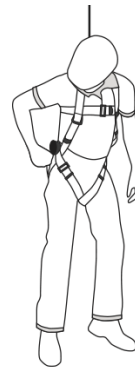
1 Abra el zipper de las bolsas colocadas en ambos lados del arnés.