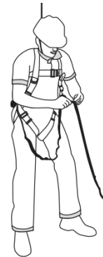
3 Conecte las correas entre sí formando un lazo con la ayuda de la hebilla.